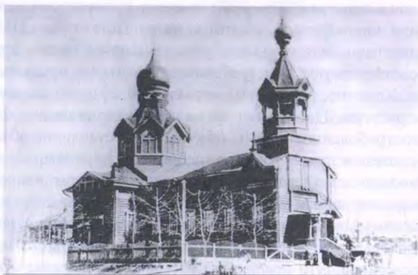
Вокзальная церковь, снесена в связи со строительством нового вокзала в 1912 г.