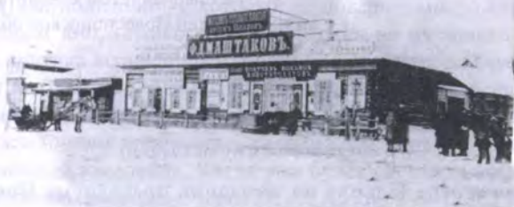
Внешний вид магазина Маишкова

«Народная летопись» – общественная, политико-экономическая и литературная газета; выходила в Новониколаевске Томской губернии в 1906 г., в 1909 – по воскресеньям, средам и пятницам, а «по сформированию печати – ежедневно». Редакторы-издатели: Н.П. Литвинов – М.О. Курский – А.Г. Новицкий. Подписка на 12 месяцев стоила 4 рубля для горожан, для иногородних – 5 рублей. (Для сравнения: в 1906г. 100 яиц стоили 2 руб. 50 коп., торт – от 1 руб. 50 коп. до 5 руб.; от 6500 до 12000 руб. составляла стоимость дома – замеч. редколлегии). В перерывах и после прекращения деятельности «Народной летописи» выходила газета «Обь».