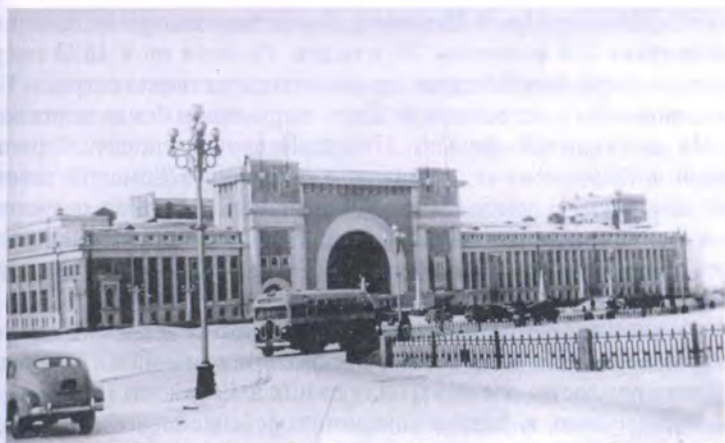
Железнодорожный вокзал, 1935 год