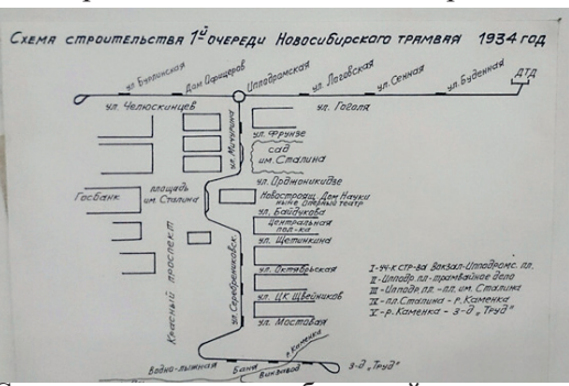
Схема развития правобережной линии за тракту (ныне – проспект 1934-1935 гг.

В 1935 году была построена трамвайная линия от Ипподромского рынка до завода им. Чкалова и продлена линия от Центра до завода «Труд», поэтому появился новый маршрут 2 «Вокзал – Ипподромский рынок – Завод им.Чкалова», проходивший по ул.Челюскинцев, ул.