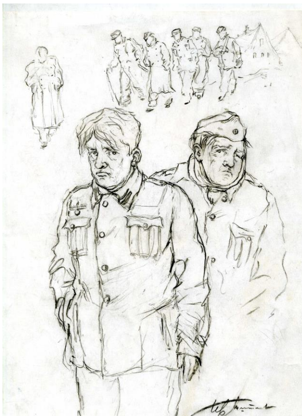
Титков И.В. «Пленные немцы». Рисунок. [1944]