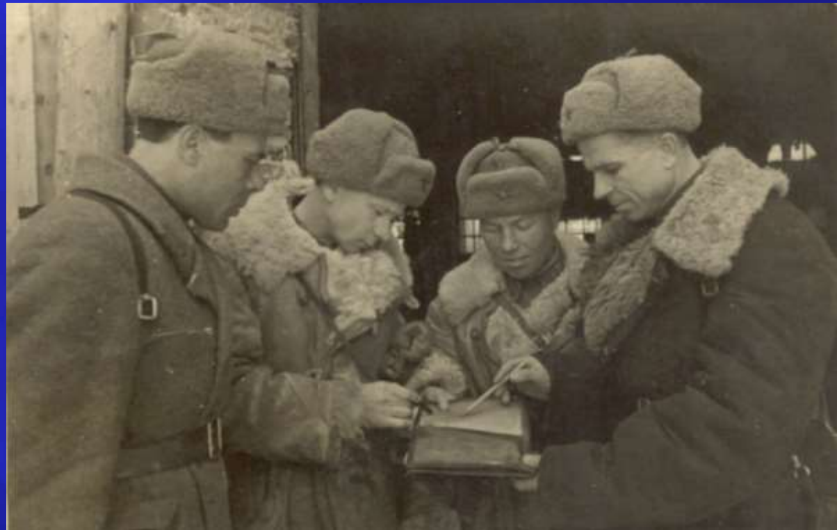
Фотография обнаружена в блиндаже 76-й Барнаульской бригады [в районе г. Локня Псковской области]