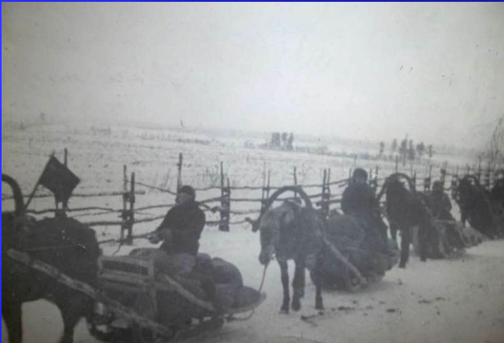
Обоз с хлебом для фронта из Мошковского района ГАНО. Ф.П – 11796. Оп. 3а. Д. 337