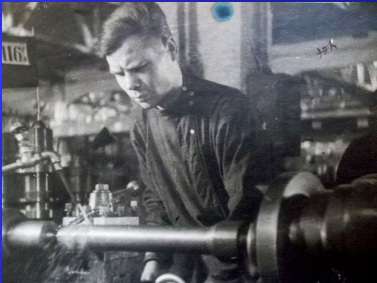
Молодежь комбината № 179 фронту ГАНО. Ф.П – 11796. Оп. 3а. Д. 399