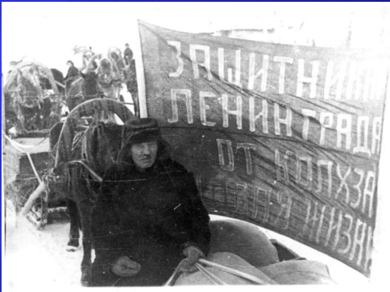
Защитникам Ленинграда от колхоза "Новая жизнь" ГАНУ. Ф.Р – 2190. Оп. 1. Д. 274 а-б