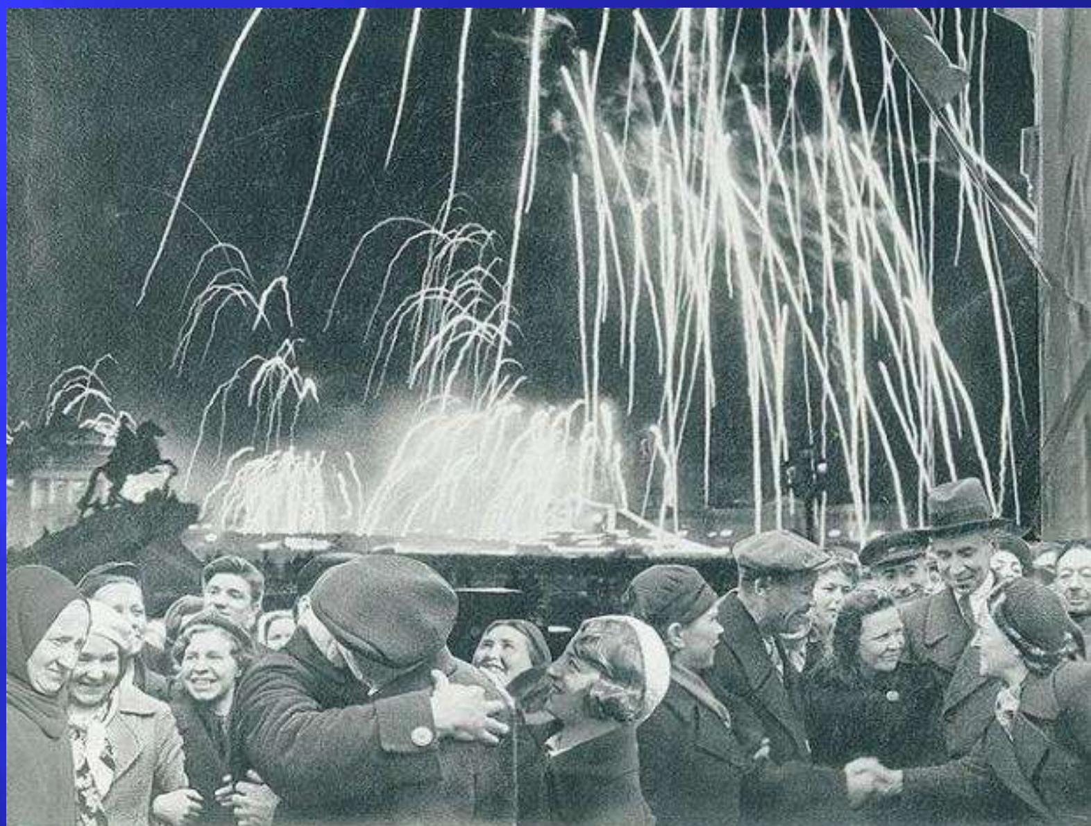
«ВЕЛИКАЯ ПОВЕДА ОДЕРЖАНА СОВЕТСКИМИ ВОЙСКАМИ ПОД ЛЕНИНГРАДОМ»