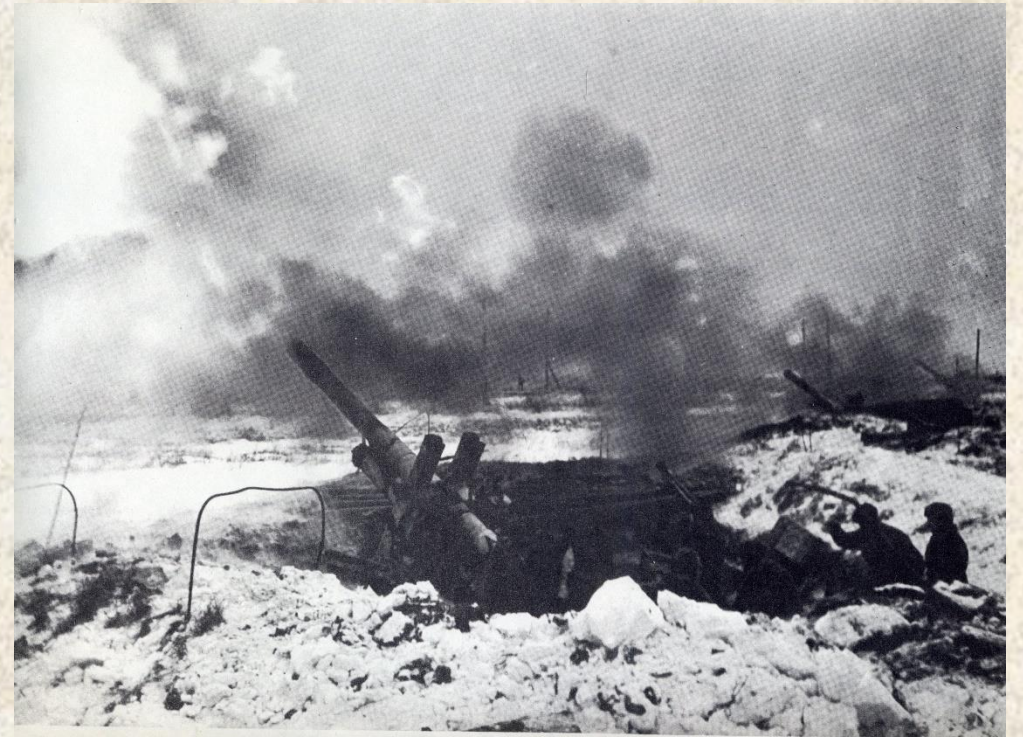
Ленинградский фронт. ГАНО. Ф. П-11796. Оп.1к. Д.98. Л.15