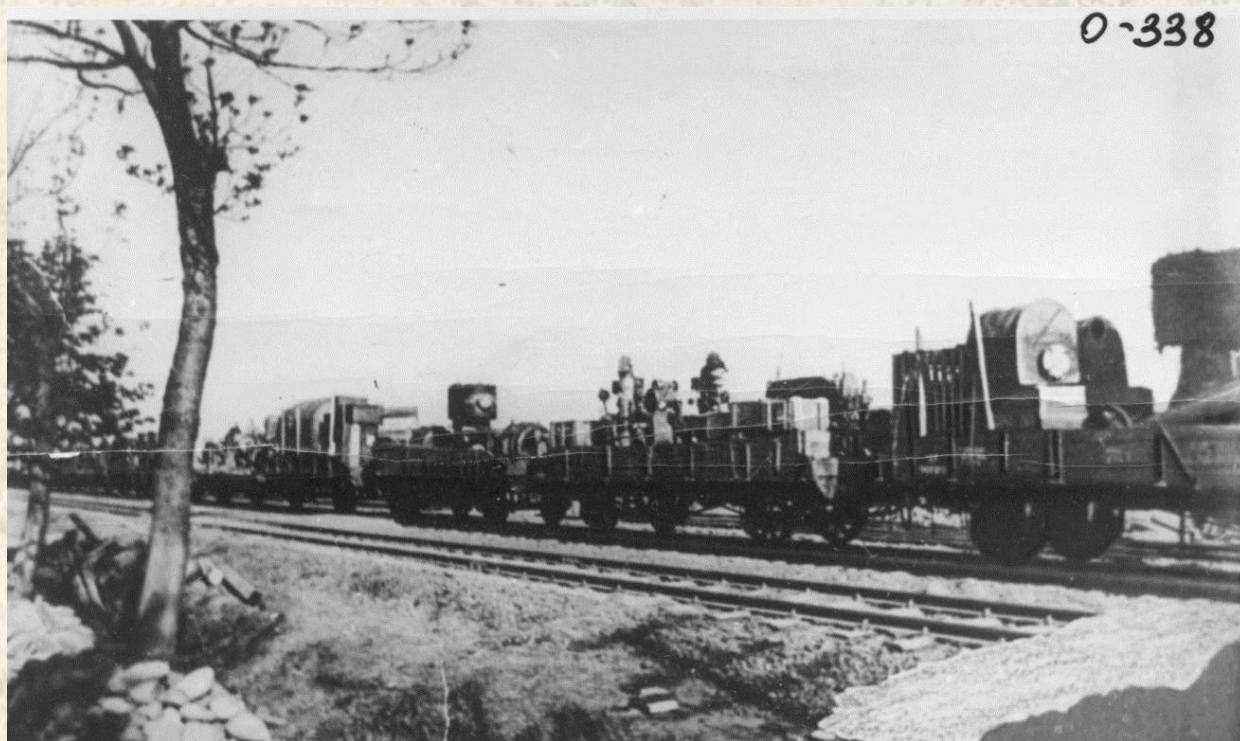
Поезд с оборудованием эвакуированного завода. 1941 г.