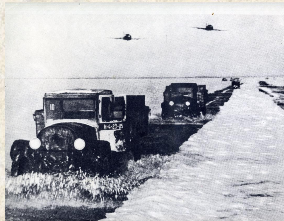
«Дорога жизни» по льду Ладожского озера. ГАНО. Ф. П-11796. Оп.1к. Д.98. Л.1