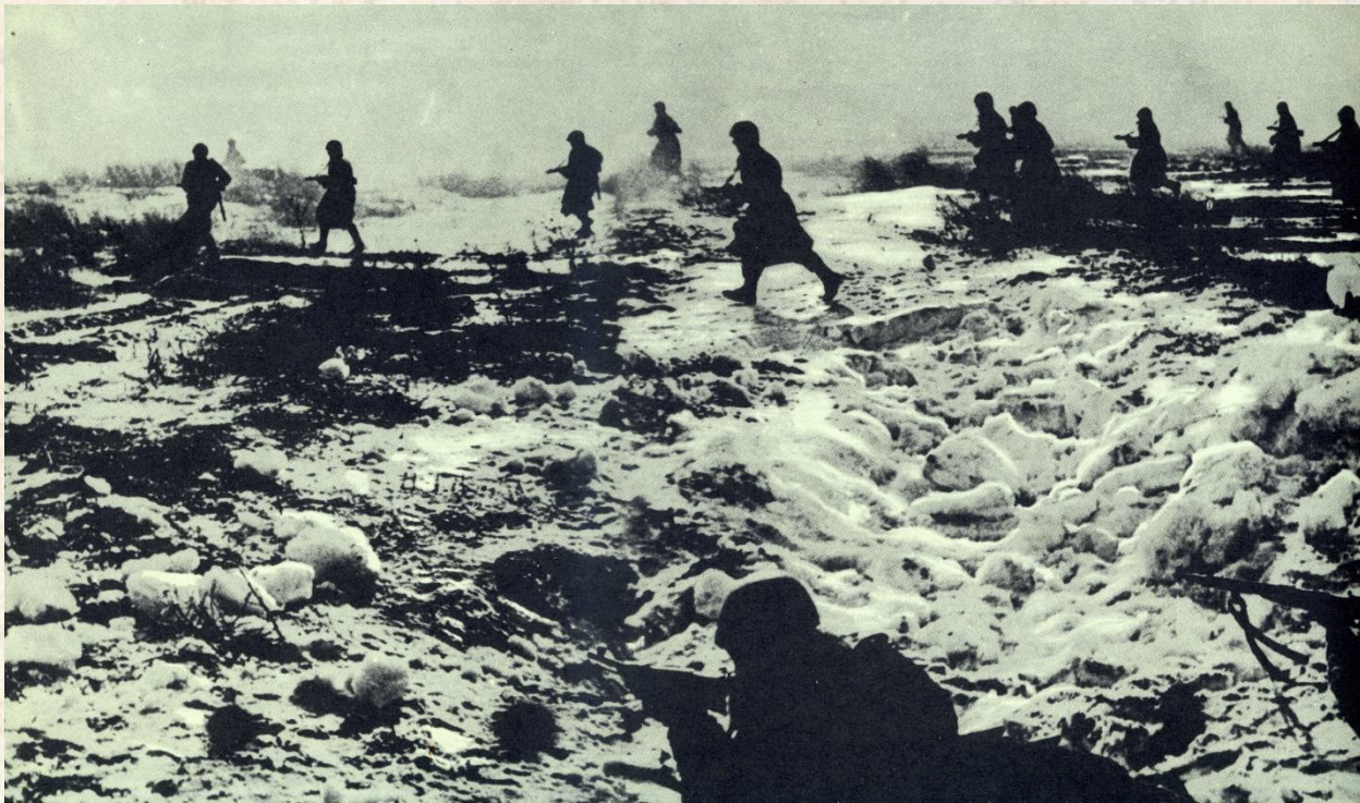
Бой у Пулкова.